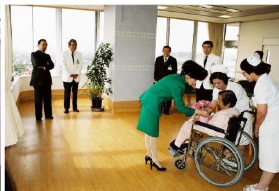
妃殿下からお見舞いの花束をもらう患者さん

これからも殿下から賜った「患者目線」「障害者の立場」の重要性を実践し、より良い病院を目指します。どうぞ安らかに眠りください。心からご冥福をお祈りいたします。