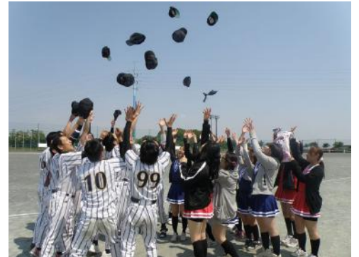
帽子を空高く投げ、勝利に喜ぶチーム一同(第2試合)