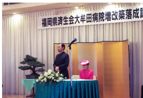
平成13年増改築落成記念式典